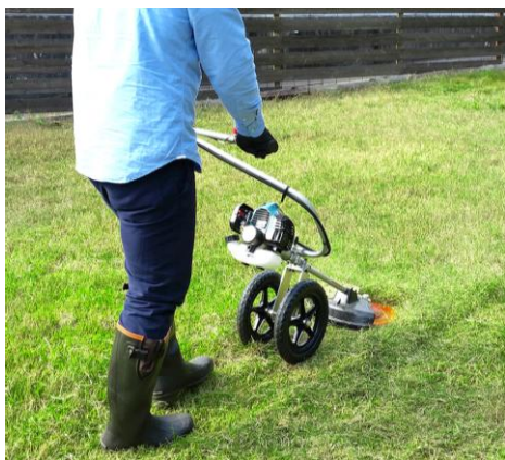
肩や腰に負担の少ないラクな姿勢で作業が行えます。

安定板の付いた手押し式のため、刈刃（あんぜんロータ）を地面に滑らせて草を刈ることができます。刈刃を持ち上げた状態で左右に動かす手持ち式の草刈機とは異なり、手押し式の草刈機は操作が安全で容易に行えます。また、2輪走行なのでしっかりと安定感も確保。作業者の負担も軽減されるため、広い場所や長時間の使用もラクに行うことができます。