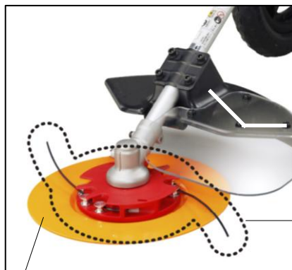
刈刃（あんぜんロータ）： ナイロンコードで草を 刈る刈刃。