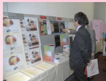
【印刷作品展示コーナー】