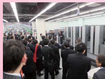
【印刷実演・デモンストレーション】

近年、熟練技術者の定年退職や人手不足が深刻化している印刷現場を補佐する新たな技術として注目を集めている新製品になります。是非とも展示会場にて、印刷オペレーターの負担軽減する新装置の「仕事ぶり」をご自身の目でじっくりとお確かめください。皆様のご来場を心よりお待ちしております。