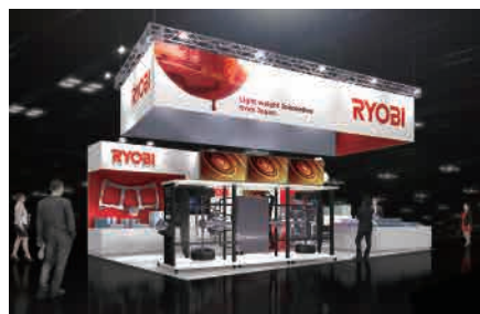
ブースのイメージ