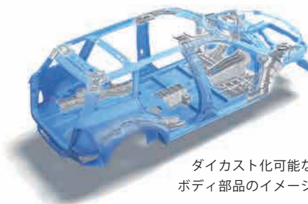
ダイカスト化可能な ボディ部品のイメージ