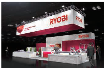
ブースのイメージ